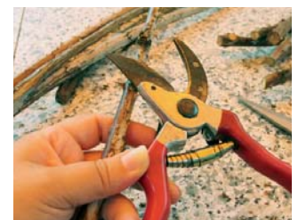
Von fingerdicken Stücken (Markdurchmesser mind. 10 mm) eine Länge von 20 bis 50 cm zuschneiden