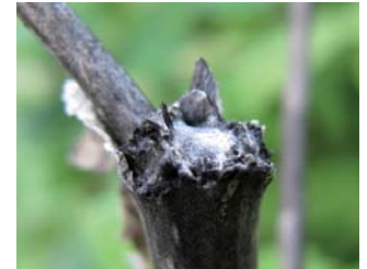
Abgestorbene Stängel brechen oder Verblühtes kann abgeschnitten werden, so wird das Mark zugänglich.