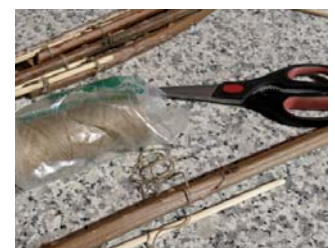
Einzeln mit Schnur oder Draht anbinden an Fenstersims, Balkongeländer, Handläufe, Zäune etc.